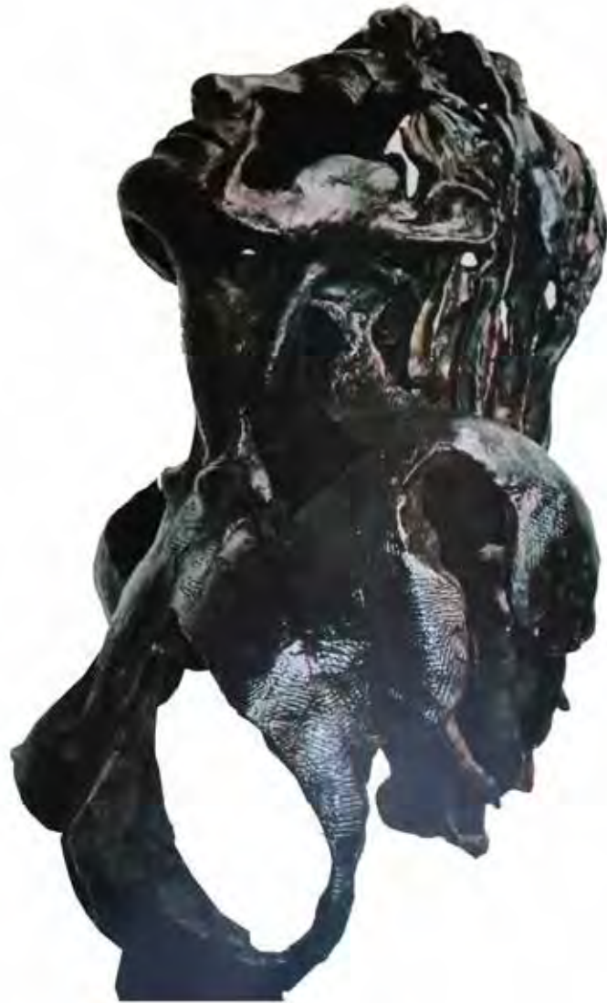
Aspirando el vacío