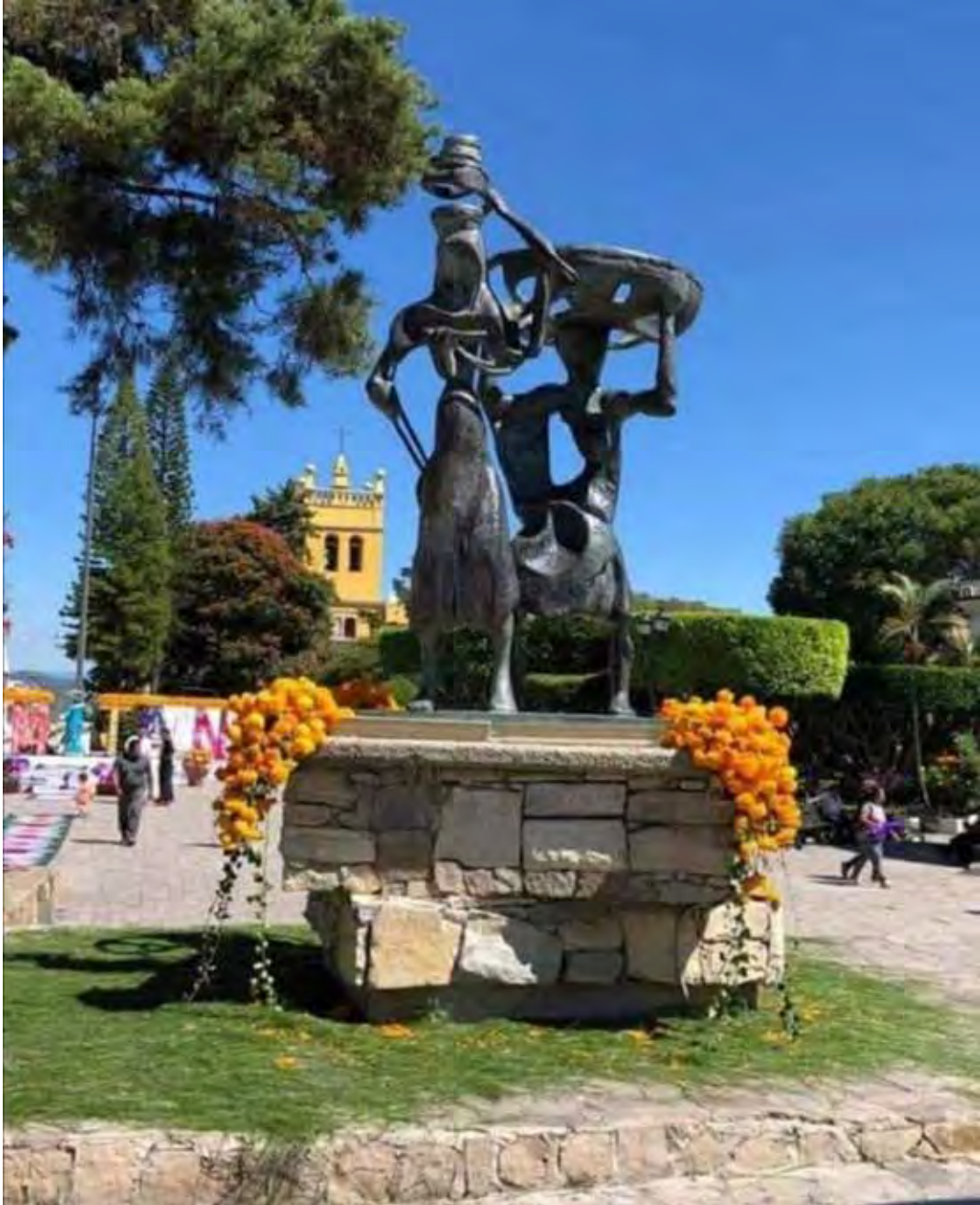
Escultura Día de Mercado en el parque central de Comitán, Chiapas, tierra natal del escultor.